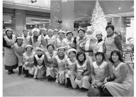
本會志工姊妹參加成大醫院聖誕慶祝活動

12月23日本會志工姊妹配合成大醫院耶誕慶祝活動，於2樓門診、病房以及9樓C區特等病房分送糖果給民眾、病患及工作人員並傳遞福音，讓門診及住院病患歡度溫馨的耶誕佳節。此外，本會志工姊妹於當天中午於八股港式海鮮餐廳舉辦本會志工年度聚餐，氣氛溫馨愉快。