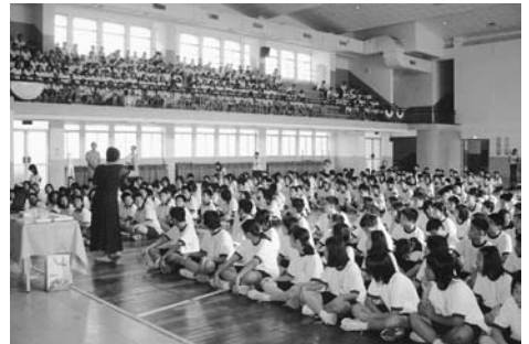
愛滋巡迴講座活動