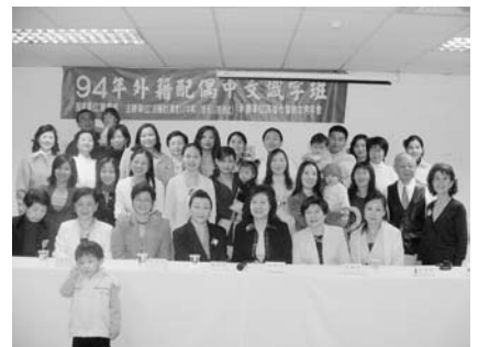
94年下學期外籍配偶中文識字班結業式一大團照

12 月 28 日中午舉辦外籍配偶結業式，邀請贊助單位高雄拾穗、中興、啟禾、東北扶輪社代表、外籍配偶及其家人一起參與，當天她們每個人都說一段感謝的話，「謝謝女青年會給我學習，我來台灣時還不會說中文，學了幾個月後，我可以自己逛街，不怕迷路了！」心中的感謝，看在眼裡，非常感動，讓中文識字班在氣氛溫馨熱鬧中，圓滿地結束。