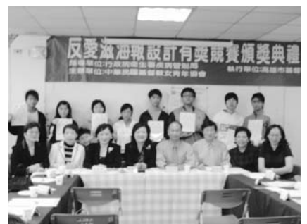
海報設計頒獎典禮—得獎同學與女青年會義工領袖大合照

今年校園反愛滋病宣導辦理校園巡迴講座外，並為青少年舉辦校園反愛滋海報設計比賽，藉由活潑的方式，讓青少年設計如何預防愛滋病的宣傳海報，於12月11日上午舉辦愛滋宣導活動海報設計頒獎典禮，當日展示優勝作品與邀請獲獎學生、指導老師、同學、家長及本會的同仁共同參與頒獎典禮。會中亦請評審講評：稱讚學生作品視覺效果佳，也給一些小小的建議，例如有的文案不清楚，有的顏色搭配要加強；並邀前三名發表設計海報的源由及對愛滋的認識：第一名同學說主題是網路愛情要預防愛滋，所以以鍵盤為中心，雙方的手一個正常，另