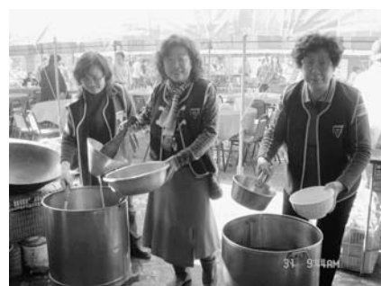
理監事們為長輩煮養生湯

活動於 12 月 31 日上午 9:00 哈瑪星代天宮廣場舉行，活動包含義診、義剪、按摩及熱食，並致贈每位老人一份敬老金。活動內容商請本市知名泰式料理泰上爺餐廳養生雞湯，代天宮師姑素湯、素麵，三奇美髮公司美髮師剪髮，鼓山區公所派出 8 位按摩師，阮綜合醫院量血壓、測血糖，東區扶輪社牙醫師們義診，漢來飯店提供甜點泡芙，而來自社會各界的關懷，讓活動氣氛 High 到最高點。